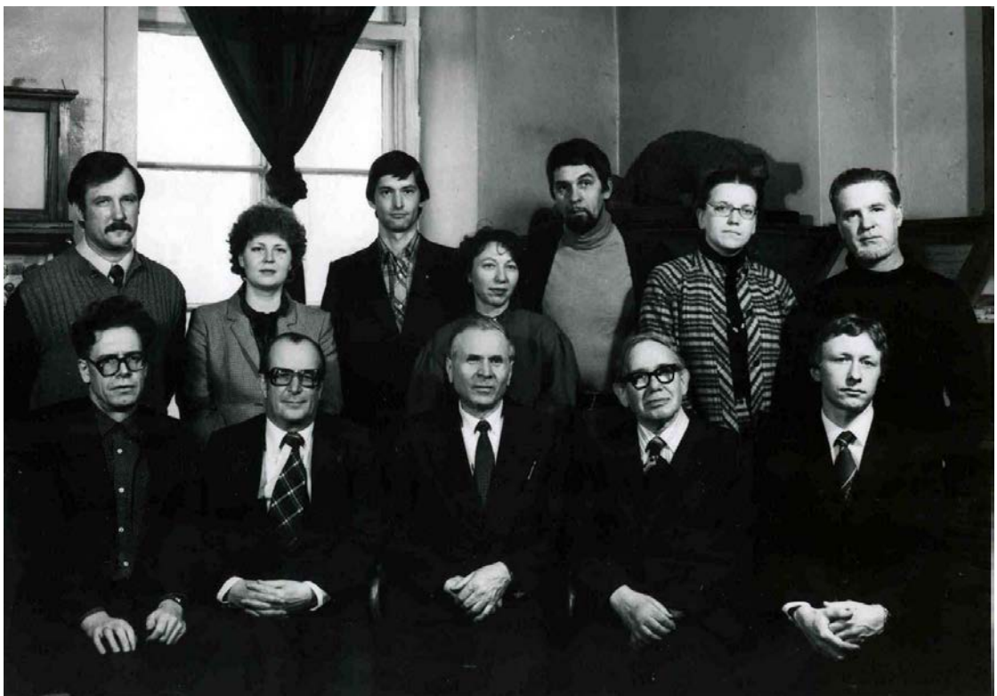
Кафедра исторической геологии. 1979 г.