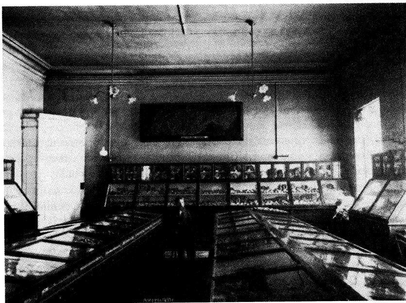
Рис. 3. Общий вид помещения Геологического музея в 1899 г.