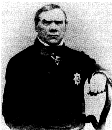
Рис. 1. Эдуард Иванович Эйхвальд (1795–1876).