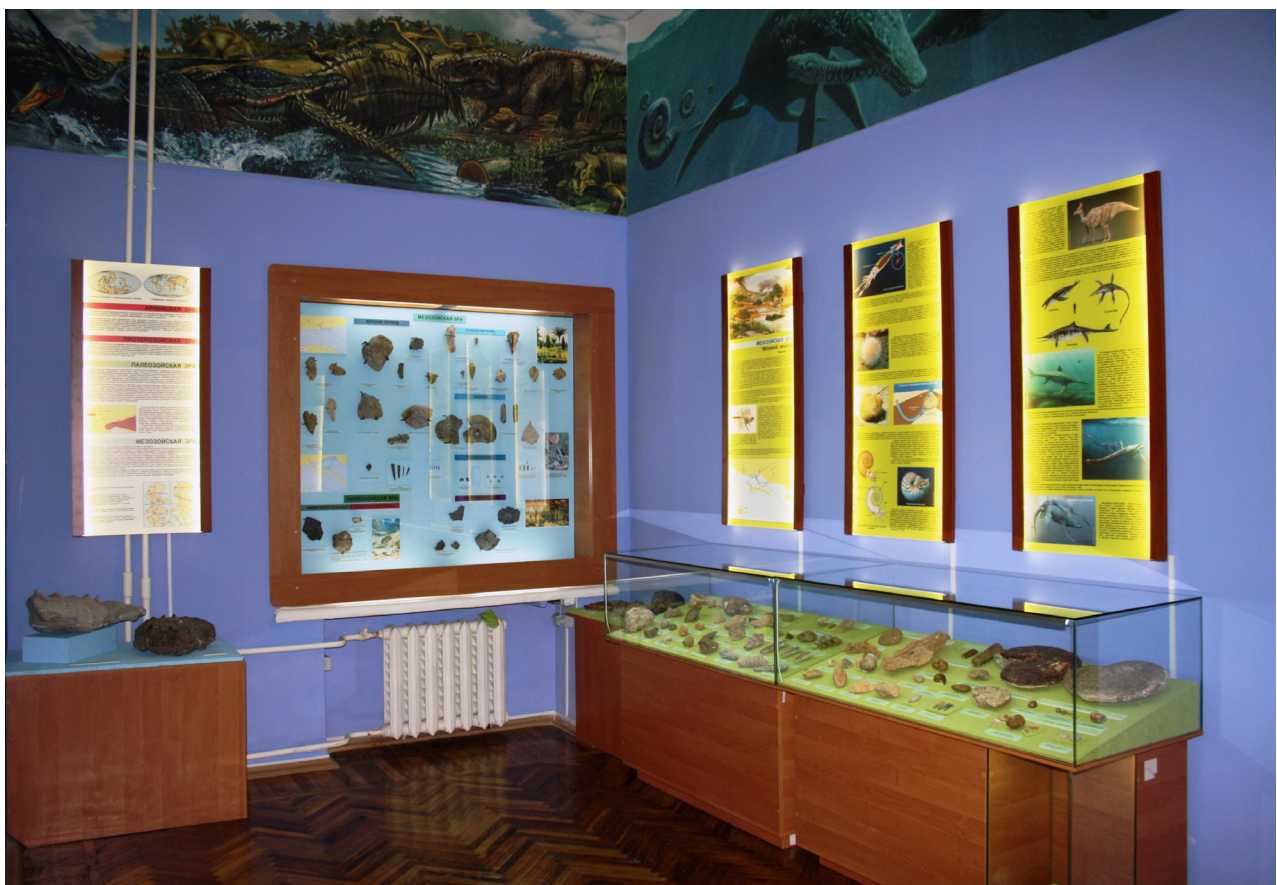
Рис. 2. Первый зал Центрального музея Тавриды, в котором выставлены образцы из коллекции Н.И. Каракаша.